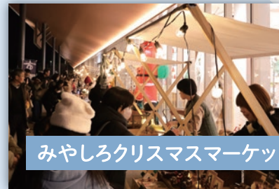
みやしろクリスマスマーケット

2025年からはじまった「みやしろクリスマスマーケット」は、12月上旬に東武動物公園駅西口駅前で行われます。あたたかいグルメやクリスマスモチーフにしたクラフト作品などが多数出店。出店者とお客様が穏やかに言葉を交わし、人と人のつながりが生まれるイベントです。