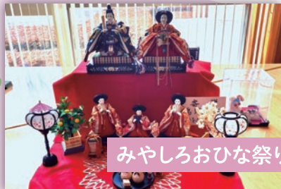
みやしろおひな祭り

まちじゅうが華やかに彩られ、受け継がれてきた伝統行事と、やさしい賑わいが広がる季節。